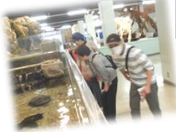
科学センター見学