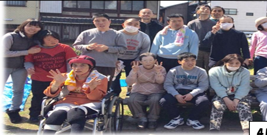
4月にみんなでお花見にいきました！