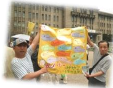
メーデーに参加しました。 たくさん歩きました！