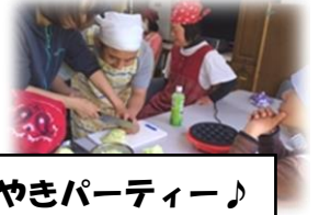
たこやきパーティー♪